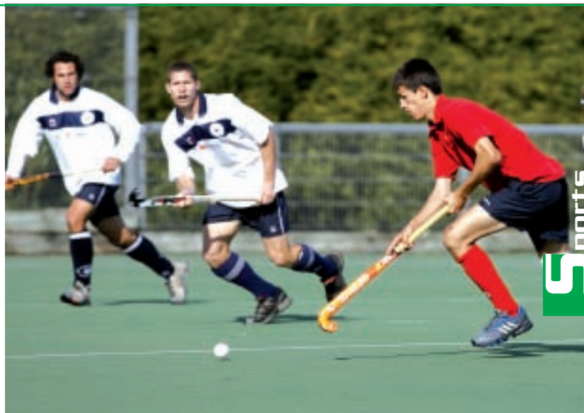
L'ASC affronte les trois premiers du championnat en trois matchs.