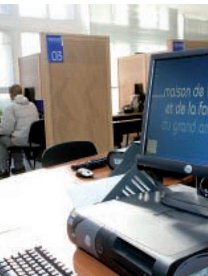
La moitié des jeunes diplômés suivis par les conseillers de la MEF trouve un travail.

► Même avec un diplôme en poche, ce n'est pas facile de trouver du travail. La Maison de l'emploi et de la formation aide les jeunes diplômés en individualisant leur recherche d'emploi.