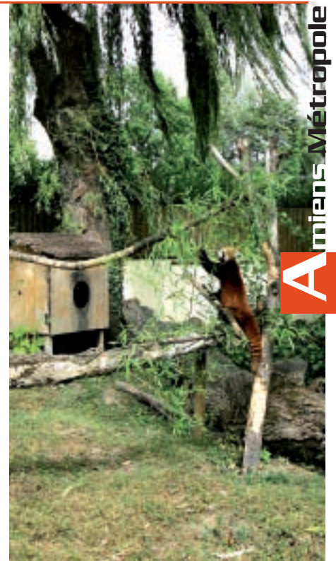
Pour le confort des animaux (ici un panda roux) les aménagements des enclos permettent une large variété de mouvements.

i Parc zoologique Esplanade de la Hotoie 03 22 69 61 00