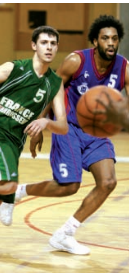
La saison 2008-2009 marquera le retour des Longacois en championnat de France.

i Amiens Sports Club / Racing Club de France Dimanche 6 avril, 15h Stade Michel-Dupontreux Rue Beaumarchais 03 60 03 20 03