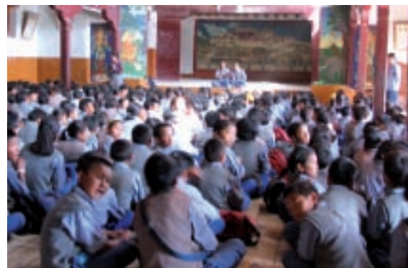
Chaque année des milliers d'enfants tibétains se réfugient en Inde, où est installé depuis 1959 le gouvernement tibétain en exil.

i Association Aide et Espoir pour le monde tibétain