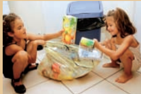
Recyclé, le plastique est réutilisé dans la fabrication de vêtements d’hiver, de couettes, de tuyaux, de revêtements de sols, de toitures...

la consommation durable sur l’île aux Fagots, l’exposition sur la biodiversité au zoo ou la pièce de théâtre Les Exp’Air seront des rendez-vous privilégiés pour transmettre ces messages aux jeunes générations et tenter de garantir la protection de la planète.