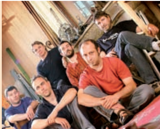
Rageous, entre ska, polka et musiques méditerranéennes.