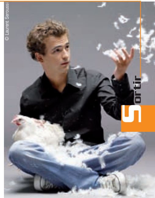
Renan Luce, deux trophées aux dernières Victoires de la musique, fait escale à Amiens vendredi 4 avril.

i Renan Luce Auditorium de Mégacité Vendredi 4 avril, 20h 0 892 704 204