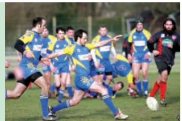
Un match qui sera l'occasion pour le club et ses supporters de montrer leur soutien aux joueurs seniors.

Les joueurs Élite du RCA s'apprêtent à jouer les derniers matchs de leur saison. Dimanche 6 avril, c'est tout le club qui sera derrière son équipe première pour sa rencontre contre Plaisir.