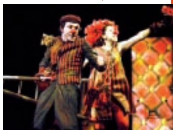
Le Jeu des sept familles du théâtre : une invitation à la découverte de l'histoire du théâtre, mouvementée !