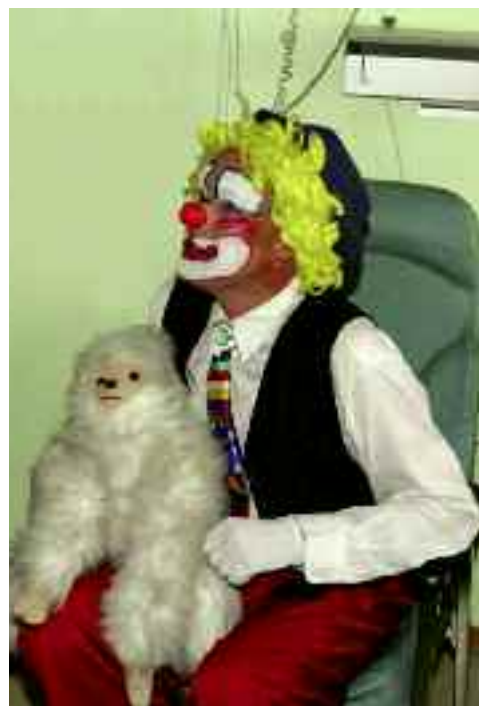
Le rire, la complicité, l'humour et la fantaisie peuvent faire partie de la vie, même à l'hôpital.

i L.N Tête 2 Belette 48, rue Marcellin-Berthelot 03 22 92 17 35