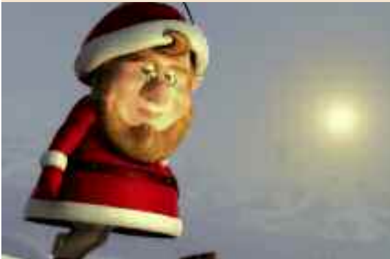
La Véritable histoire de Pierre Noël a reçu le prix du film d'animation lors de l'édition 2007 de la Nuit du court.

Pour la quatrième année consécutive, l'association amiénoise Bulldog, en partenariat avec le Ciné St-Leu et l'IUT Tech de Co, propose aux amoureux des formes courtes de découvrir des films amateurs ou semi-amateurs (issus d'écoles de cinéma, par exemple). La Nuit du court se tiendra le 24 avril à partir de 20h. En deux parties entrecoupées d'un entracte lors duquel un cocktail sera proposé au public, une quinzaine de courts-métrages, essentiellement vidéo et venus de toute la France, seront en lice dans le cœur des spectateurs et des membres du jury pour l'obtention de quatre prix : grand prix, prix du jury, prix d'animation et prix du public. Les auteurs seront présents pour répondre aux questions des spectateurs chaque année plus nombreux à venir découvrir les films de jeunes cinéastes d'aujourd'hui et peut-être grands réalisateurs de demain.