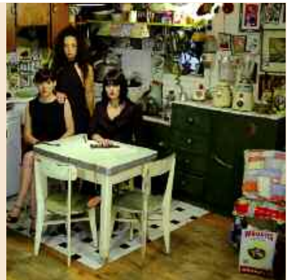
Le groupe Tu seras terriblement gentille cuisine un rock bondissant.