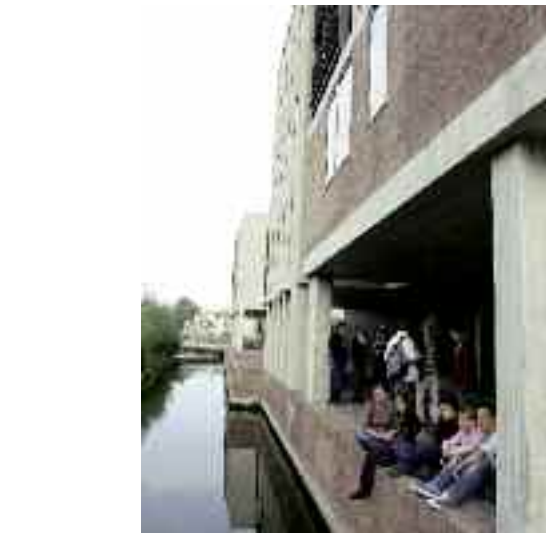
Saint-Maurice est un pôle universitaire important, à terme, le transfert des facultés est prévu à la Citadelle.