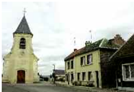
Saint-Saulfieu a intégré Amiens Métropole en janvier 2007.