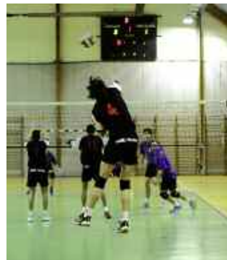
Dimanche 27 avril, l'AMVB mènera deux combats : assurer le maintien et lutter contre les discriminations.