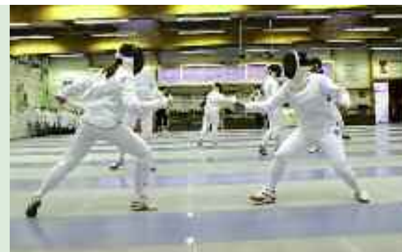
Le Cercle d'escrime d'Amiens vise la première place au Championnat de France.