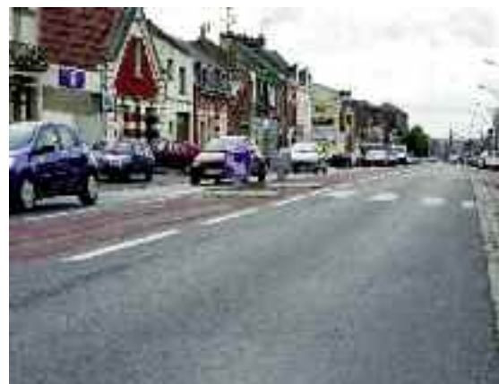
Les différents travaux de voirie permettront d'enterrer les réseaux.