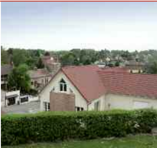
Saveuse sera le cadre d'une marche gourmande... À découvrir le 21 juin.