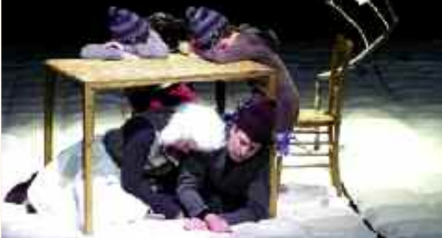
L'hiver, 4 chiens... une œuvre poétique récompensée aux Molières.