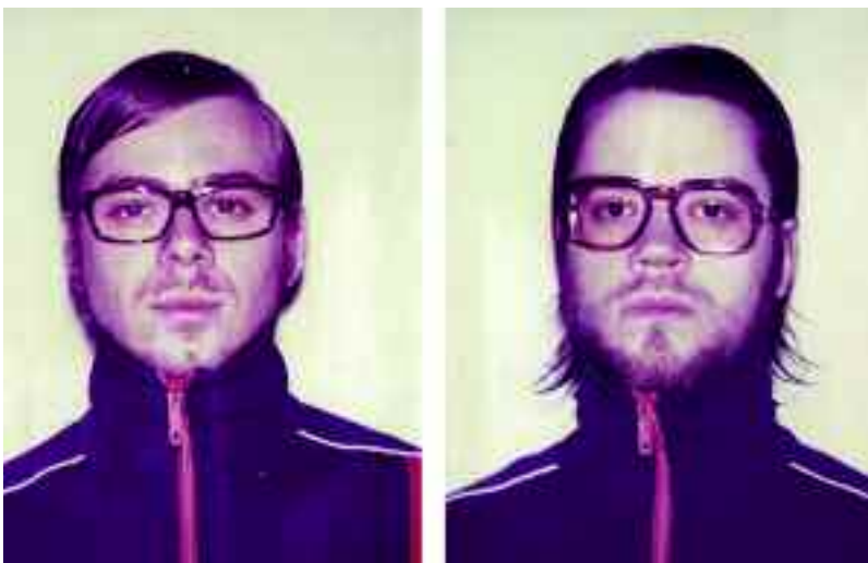
Curry & Coco : cocktail explosif de punk, rock et électro.