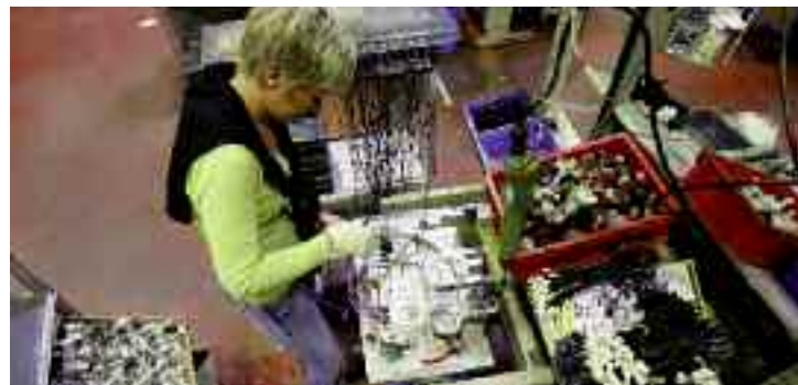
Mauvaises positions, gestes à répétition : les troubles musculo-squelettiques constituent la première maladie professionnelle.