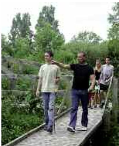
Le Sentier découverte de l'étang Saint-Ladre sera inauguré le 24 mai.