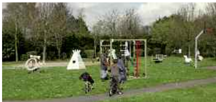
Une aire de jeux permet aux enfants de Sains de se défouler après l'école.

Ce frein à l'urbanisation permet en revanche à la commune de se pencher sur d'autres projets.