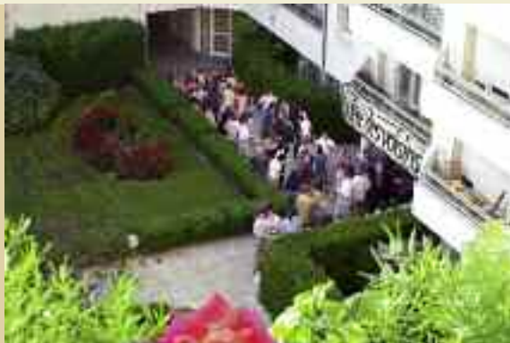
La Fête des voisins, un moment convivial pour se connaître en dépassant le simple bonjour matinal.