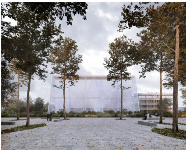
Vue projetée de la BnF depuis le mail central site du CHU