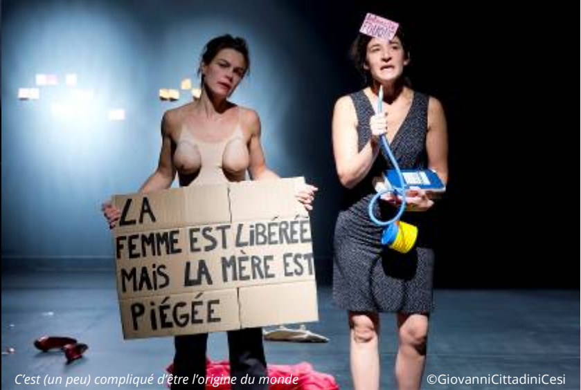
C'est (un peu) compliqué d'être l'origine du monde