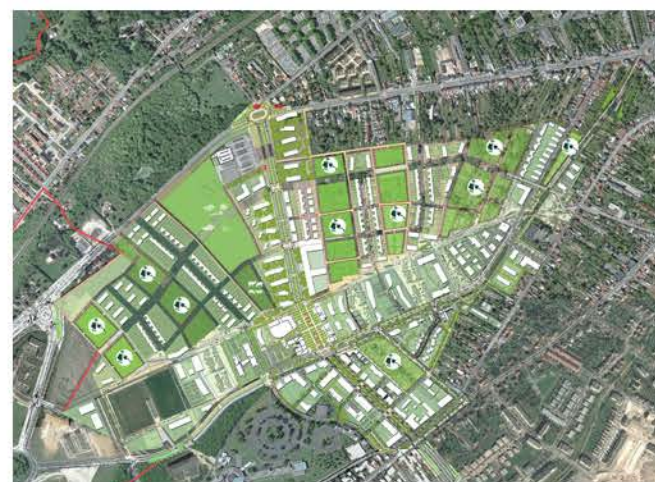
Plan masse indicatif du projet

* se reporter aux définitions contenues dans l'article 24 des dispositions générales du règlement