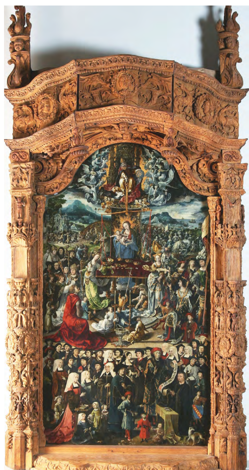
Maître d'Amiens, Puy de 1518, Au juste pois véritable balance

« Exposition réalisée avec le concours exceptionnel de la Bibliothèque nationale de France »