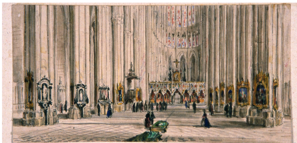
Aimé ou Louis Duthoit, Vue rétrospective de la cathédrale d'Amiens ornée de ses Puy