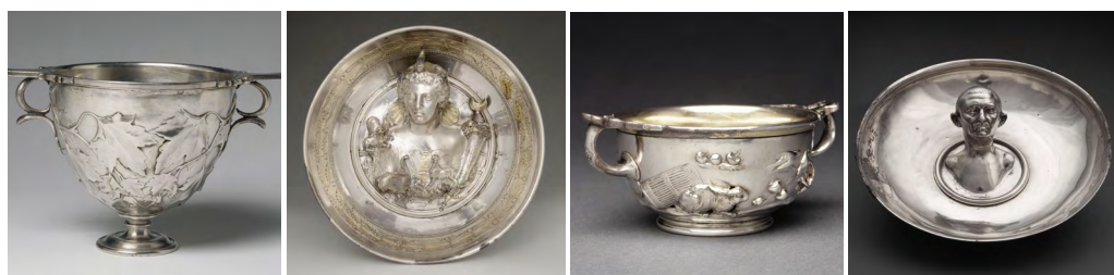
Trésor de Boscoreale, Paris, Musée du Louvre, argent.

Ce va-et-vient entre présent et passé, découvertes scientifiques et rêveries artistiques, ne manquera pas de surprises !