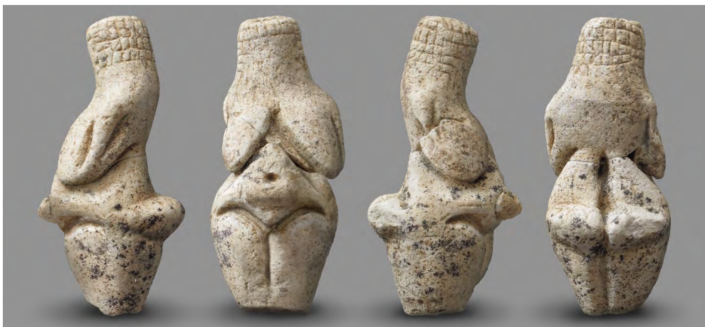
Vénus de Renancourt, Musée de Picardie © Stéphane Lancelot, Inrap. Affiches - Illustration d'Isabelle Dethan et Mazan.

L'archéologie est une discipline indéniablement populaire. Quoiqu'en réalité mal connue du grand public, elle éveille chez lui des rêves d'aventures. Comme les archéologues, les autrices et auteurs de bande dessinée qui s'intéressent au passé analysent et décortiquent les matériaux divers dont ils disposent, et tentent avec eux de raconter une histoire, des histoires. Ils s'efforcent de donner sens à des traces et de combler des vides, ils élaborent des scénarii, les font évoluer, les confrontent à des lecteurs attentifs.