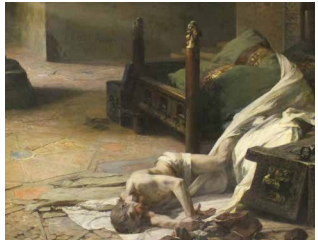
La Mort de Guillaume le Conquérant , Albert MAIGNAN, 1885