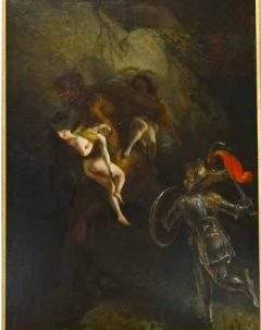
Sujet extrait du Boyardo , Louis Edouard RIOULT, 1831