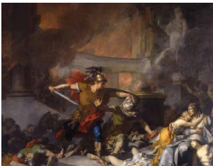
Mort de Priam , Jean Baptiste REGNAULT, 1785