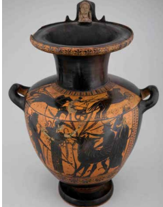
Hydrie avec Hercule et Cerbère , VI e s. avant JC