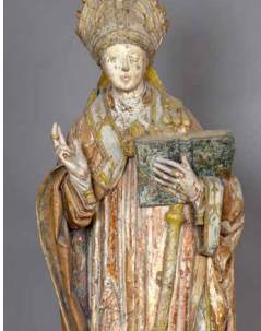
Statue de saint Blaise , vers 1500-1510