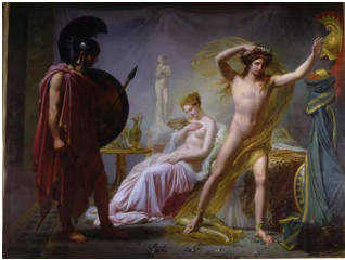
Hector adressant des reproches à Pâris , Pierre-Claude-François DELORME, 1824